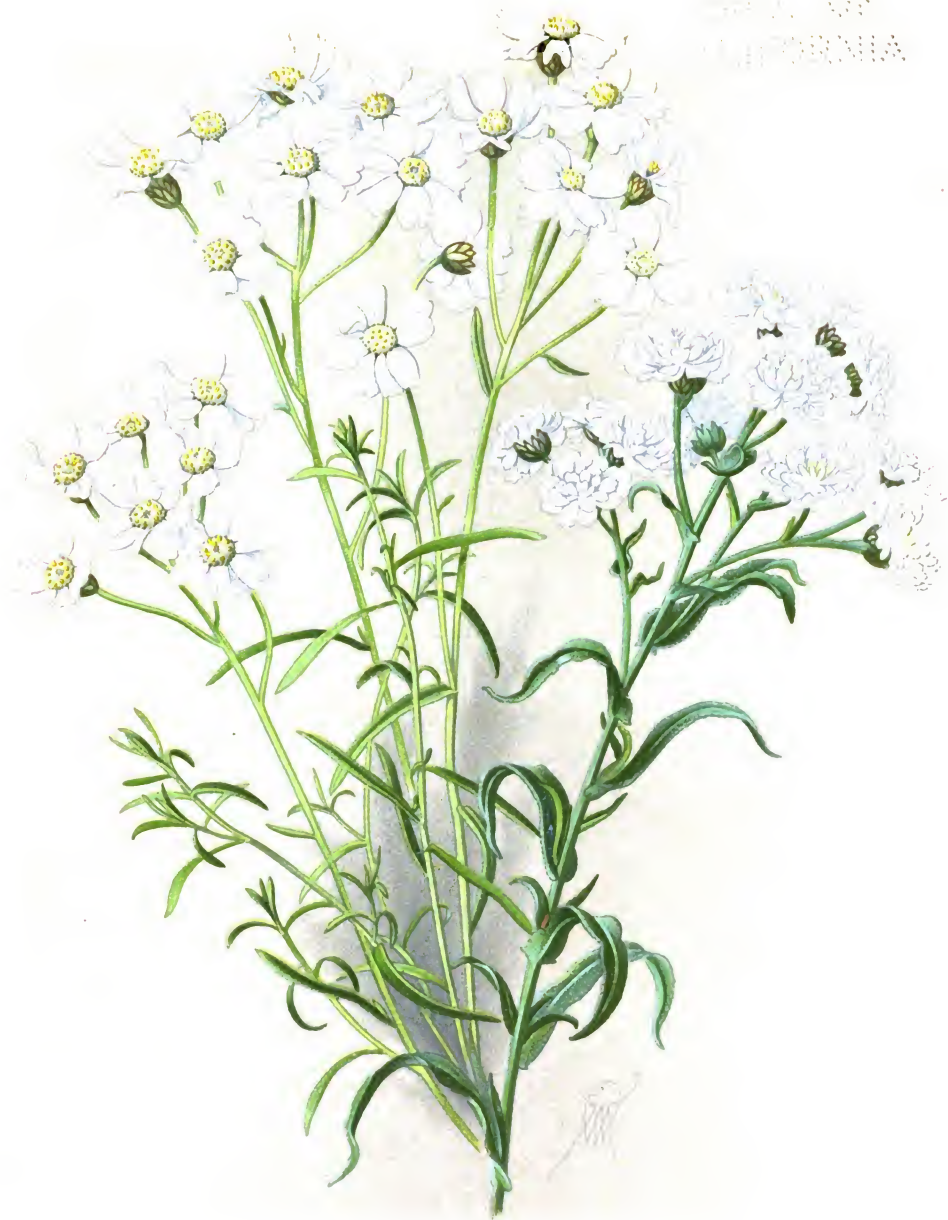
Achillea mongolica u Achillea Ptarmica flore pleno „The Pearl“.

Деревей монгольскій и махровый деревей "Перль".